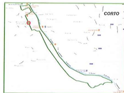
Corto km 7