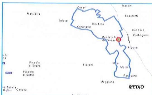
Medio km 14